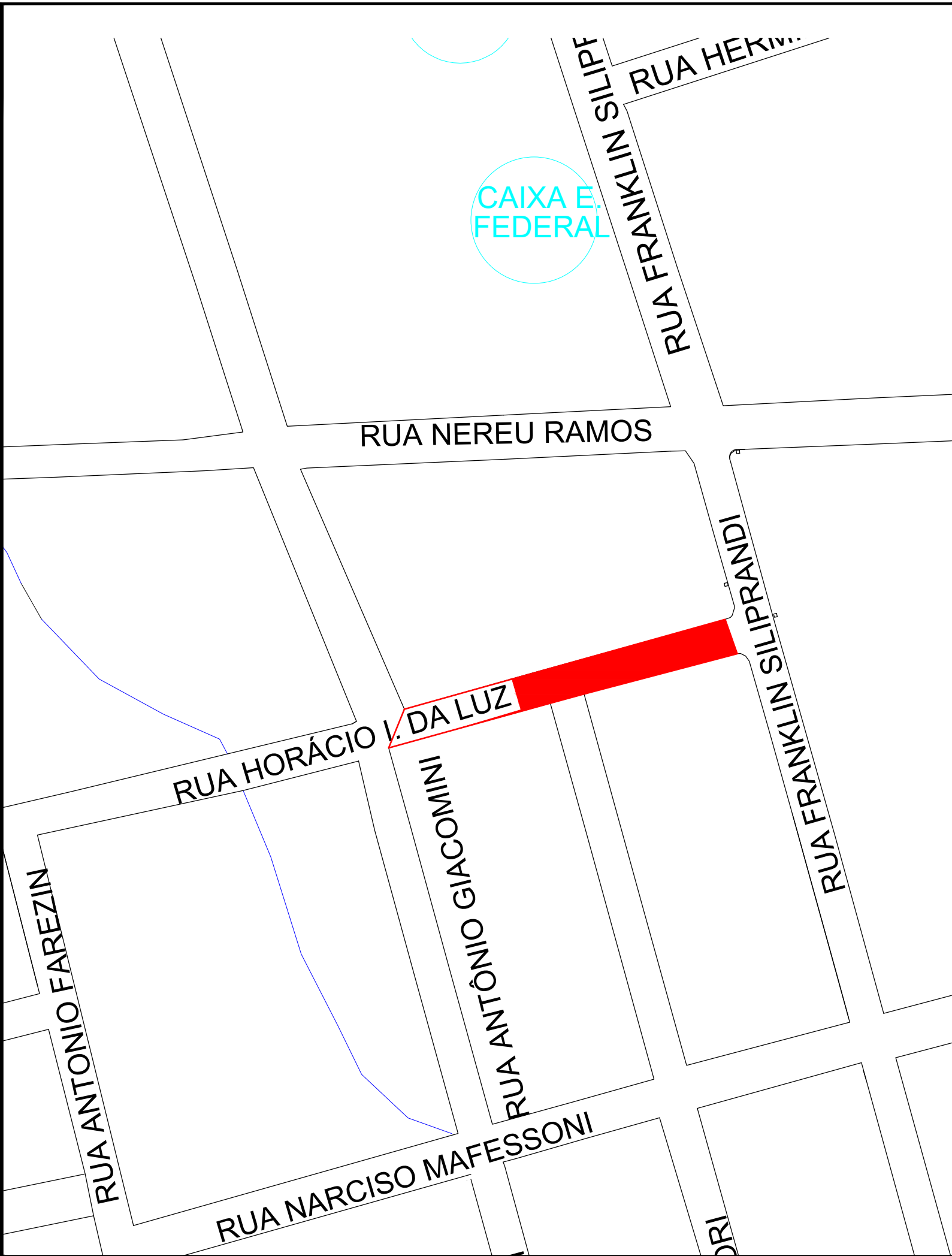
LOCALIZAÇÃO DOS MATERIAIS DA JAZIDA DE USINA DE CBUQ