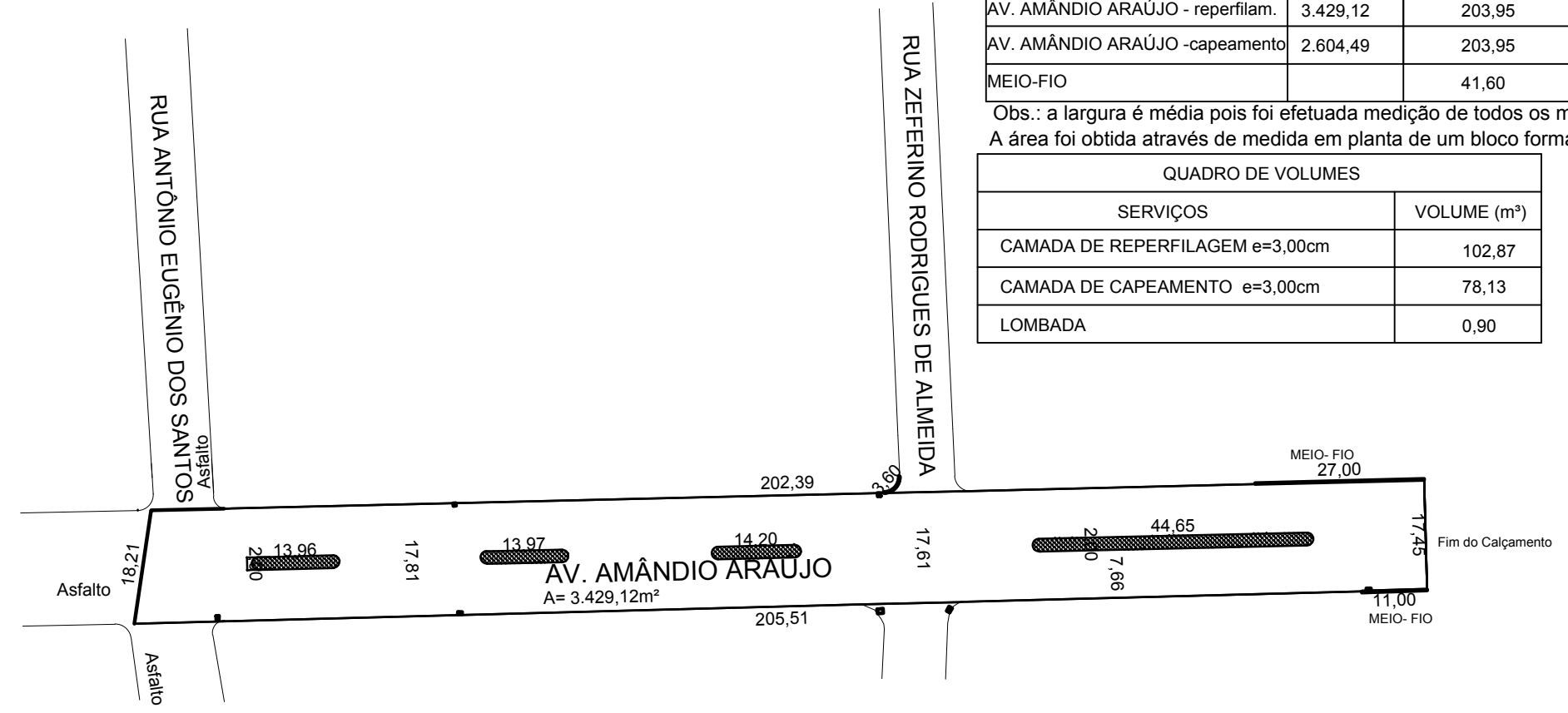
PROJETO GEOMÉTRICO - REPERFILAMENTO E MEIO FIO - AV. AMÂNDIO ARAÚJO ESC.: 1/1.000